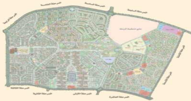
المخطط العام للرحاب